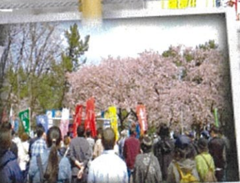
青森地区会場にて