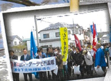
碓氷地区会場にて