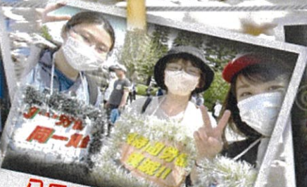
八戸地区会場にて