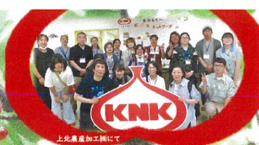
上北農産加工工場にて

去る6月26日 南部方面日帰りバスツアーを執行することが出来ました。報道のとおり、さくらんぼが不作のため、予定を変更して工場見学を入れたりしましたが、農園の皆様の計らいで思った以上に楽しむことができたと思います。