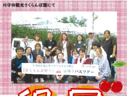
川守田観光さくらんぼ園にて

去る6月26日 南部方面日帰りバスツアーを執行することが出来ました。報道のとおり、さくらんぼが不作のため、予定を変更して工場見学を入れたりしましたが、農園の皆様の計らいで思った以上に楽しむことができたと思います。