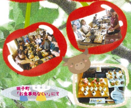
田子町「お食事処なくい」にて